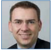
Jan Mücke, Parlamentarischer Staatssekretär beim Bundesminister für Verkehr, Bau und Stadtentwicklung