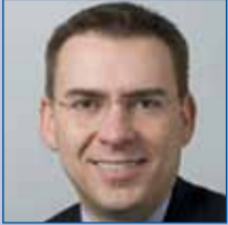
Jan Mücke, Bundesministerium für Verkehr, Bau und Stadtentwicklung