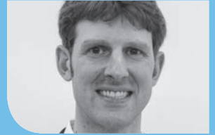
Christian Grau Sport-Tiedje