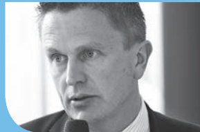
Ludger Niemann DECATHLON Sportartikel